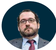
João Costa Ministro da Educação