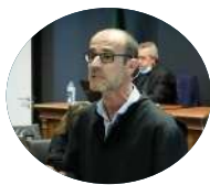
Jorge Albino Costa SE Adjunto e da Justiça

Licenciada em Relações Internacionais, serviu na Marinha portuguesa entre 1996 e 2000. Em 2000 ingressou nos quadros da Autoridade Nacional de Emergência e Proteção Civil. Entre 2007 e 2013 desempenhou funções como Adjunta de Operações Nacional. Em 2013 foi nomeada Comandante Operacional Distrital de Setúbal, cargo desempenhado até 2017, altura em que foi nomeada 2ª Comandante Operacional Nacional da ANEPC. No anterior Governo foi Secretária de Estado da Administração Interna.