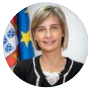
Marta Temido Ministra da Saúde