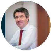
José Luís Carneiro Ministro da Administração Interna