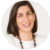
Ana Catarina Mendes Ministra Adjunta e dos Assuntos Parlamentares