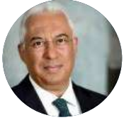
António Costa Primeiro-Ministro