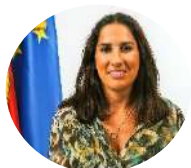
Marina Gonçalves SE da Habitação

Licenciada e Mestre em Direito. Exerceu atividade como advogada até 2015, momento em que iniciou funções como assessora do gabinete do SE dos Assuntos Parlamentares. Entre 2018 e 2019 desempenhou funções de Chefe do Gabinete, primeiro no Gabinete do SE dos Assuntos Parlamentares e depois no Gabinete do Ministro das Infraestruturas e da Habitação. Entre 2019 e 2020 desempenhou funções como deputada. Exerceu no último governo o cargo de SE da Habitação.