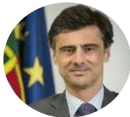
Tiago Antunes SE dos Assuntos Europeus