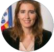
Ana Mendes Godinho Ministra Trabalho, Solidariedade e Segurança Social

Licenciado em Sociologia e Pós-graduado em Gestão Empresarial. Desde 2010 exerce as funções de vogal da Comissão Executiva da aicep Global Parques. Desde 2002 desenvolveu a sua atividade profissional no sector privado como gestor e administrador de diversas empresas. Entre 1997 2002 foi SE da Juventude.