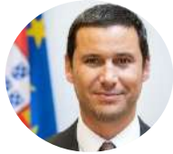
João Galamba SE do Ambiente e da Energia

Licenciado em Economia. Trabalhou no Banco Santander de Negócios, na consultora DiamondCluster International, na Presidência portuguesa do Conselho da União Europeia e na Unidade de Missão para os Cuidados Continuados Integrados. Deputado na XI, XII e XIII Legislaturas. Foi Secretário de Estado da Energia desde outubro de 2018 e posteriormente SE Adjunto e da Energia.