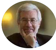
Mário Campolargo SE da Digitalização e da Modernização Administrativa