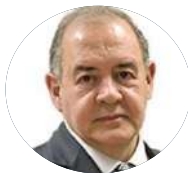
António Costa e Silva Ministro da Economia e do Mar