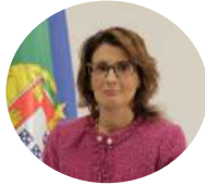
Catarina Sarmiento e Castro Ministra da Justiça