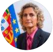
Ana Abrunhosa Ministra da Coesão Territorial