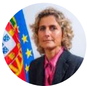
Ana Abrunhosa Ministra da Coesão Territorial