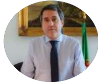
Francisco André SE Negócios Estrangeiros e Cooperação