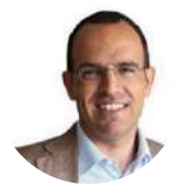
Pedro Adão e Silva Ministro da Cultura