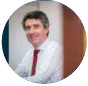
José Luís Carneiro Ministro da Administração Interna