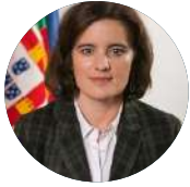
Mariana Vieira da Silva Ministra da Presidência