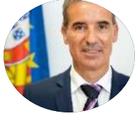
João Catarino SE da Conservação da Natureza e Florestas

Licenciado em Engenharia Agronómica e bacharel em Engenharia de Produção Florestal. De 1999 a 2004 exerceu o cargo de Vereador na Câmara Municipal de Proença-a-Nova. Adjunto do Secretário de Estado do Desenvolvimento Rural das Florestas em 2005. De 2005 a 2016 foi Presidente da CM de Proença-a-Nova. Em 2018 foi nomeado para SE da Valorização do Interior, tendo na última legislatura sido nomeado para SE da Conservação da Natureza, das Florestas e do Ordenamento do Território.