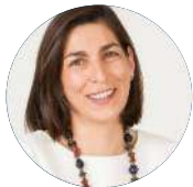
Ana Catarina Mendes Ministra Adjunta e dos Assuntos Parlamentares

Oficial da marinha, advogada, consultora de direitos humanos, formadora e coach. Nos últimos 6 anos, cumpriu a formação de mediadora de conflitos e coach certificada, maioritariamente para profissionais de desenvolvimento ou cooperação internacional e agências das Nações Unidas na área dos Direitos Humanos.