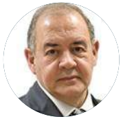
António Costa e Silva Ministro da Economia e do Mar

Licenciado em Economia e Mestre em Administração e Políticas Públicas. Foi chefe do Gabinete do Ministro da Economia e da Inovação entre 2005 e 2007, tendo posteriormente sido vogal do Conselho Diretivo do IAPMEI entre 2007 e 2010. Exerceu o cargo de Administrador da BIAL até 2018, ano em que foi nomeado para Secretário de Estado da Economia, passando posteriormente a exercer o cargo de SE Adjunto e da Economia, até aos dias de hoje.