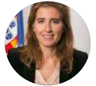
Ana Mendes Godinho Ministra do Trabalho, Solidariedade e Segurança Social