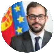
Duarte Cordeiro Ministro do Ambiente e Ação Climática

Licenciado em Engenharia Agronómica e bacharel em Engenharia de Produção Florestal. De 1999 a 2004 exerceu o cargo de Vereador na Câmara Municipal de Proença-a-Nova. Adjunto do Secretário de Estado do Desenvolvimento Rural das Florestas em 2005. De 2005 a 2016 foi Presidente da CM de Proença-a-Nova. Em 2018 foi nomeado para SE da Valorização do Interior, tendo na última legislatura sido nomeado para SE da Conservação da Natureza, das Florestas e do Ordenamento do Território.