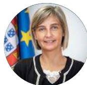
Marta Temido Ministra da Saúde

Licenciado em Medicina e autor de publicações na área da medicina desportiva e do envelhecimento saudável e ativo. Deputado à Assembleia da República na XIII Legislatura. Foi Médico ortopedista no Hospital de Leiria até ao início da XIII Legislatura. No último Governo exerceu as funções de Secretário de Estado Adjunto e da Saúde.