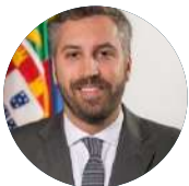
Pedro Nuno Santos Ministro das Infraestruturas e Habitação

Licenciado em Sociologia e mestre em Políticas Públicas. Foi assessor da Ministra da Educação entre 2006 e 2009 e adjunto do SE Adjunto do Primeiro-Ministro entre 2009 e 2011. Entre 2015 e 2019 foi adjunto do SE dos Assuntos Parlamentares e em 2019 adjunto do Ministro das Infraestruturas e da Habitação. Exerceu funções de Chefe do Gabinete do Ministro das Infraestruturas e da Habitação entre 2019 e 2020. Nomeado em 2020 para Secretário de Estado Adjunto e das Comunicações.