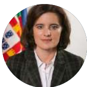
Mariana Vieira da Silva Ministra da Presidência