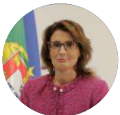
Catarina Sarmento e Castro Ministra da Justiça

Licenciado em Direito e pós-graduado em Direito Comunitário. Magistrado, foi membro do Conselho Superior do Ministério Público, docente no Centro de Estudos Judiciários, assessor no Tribunal Constitucional (Gabinete do Ministério Público) e Secretário da Procuradoria-Geral da República. Foi chefe do Gabinete do Ministro da Justiça (1999), Coordenador Adjunto de Equipa de Missão (2000), Subinspetor-Geral da Inspeção-Geral dos Serviços de Justiça (2014-2015) e Chefe do Gabinete da Ministra da Administração Interna (2015-2017).