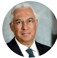
António Costa Primeiro-Ministro