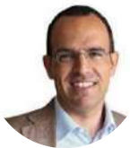
Pedro Adão e Silva Ministro da Cultura

Formado em Engenharia Química, foi adjunto do Presidente da Câmara de Viana do Castelo (1994-97); Vereador da Câmara Municipal de Viana do Castelo (1998-2009) e Presidente da Câmara Municipal Viana Castelo de 2009 a 2017. Foi Presidente da Assembleia Geral da Rede Portuguesa das Cidades Saudáveis; do Eixo Atlântico; da Conferência das Cidades do Atlântico; e da Rede Ibérica de Entidades Transfronteiriças.