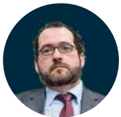
João Costa Ministro da Educação

Licenciado, Mestre e Doutor em Economia. Diretor do CIPES – Centro de Investigação em Políticas do Ensino Superior e Professor Associado da Faculdade de Economia da Universidade do Porto. Desde abril de 2016 é conselheiro para o Ensino Superior e Ciência do Presidente da República. Foi Vice-Reitor para os Assuntos Académicos da Universidade do Porto (2014-2018) e foi também membro do Conselho Nacional de Educação de Portugal (2014-2018). É membro da Direção da Fundação BIAL (desde 2015) e foi membro do Conselho Consultivo de Educação da Fundação Francisco Manuel dos Santos (2013-2018).