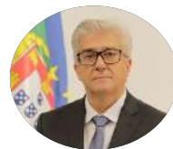
António Lacerda Sales SE Adjunto e da Saúde

Licenciada em Direito. Foi assessora jurídica do vereador da Mobilidade da Câmara Municipal de Lisboa entre 2007 e 2013. Em 2010 ficou responsável pelos trabalhos do Plano de Acessibilidade Pedonal de Lisboa, tendo transitado em 2013 depois para a EMEL, onde foi provedora do cliente. Foi deputada pelo Partido Socialista nas eleições legislativas de 2015 e 2019. Exerceu o cargo de Secretária de Estado da Inclusão das Pessoas com Deficiência no XXI e XXII Governo Constitucional.