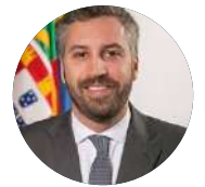
Pedro Nuno Santos Ministro das Infraestruturas e Habitação