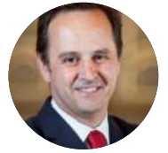
Fernando Medina Ministro das Finanças