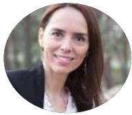
Sara Guerreiro SE da Igualdade e Migrações

Licenciado em Gestão. Foi assessor económico do Gabinete do Primeiro Ministro entre 1996 e 1999. Foi Secretário de Estado do Planeamento entre 1999 e 2002. Entre 2002 e 2007 desempenhou funções de administrador em unidades de negócio do Grupo Amorim, posteriormente diretor de áreas de desenvolvimento e atividades internacionais da Galp até 2016. Desempenhou funções como Presidente do Conselho de Administração do Grupo Águas de Portugal até 2019. Desde maio de 2020 liderou as negociações da Ajuda de Estado ao Grupo TAP. Exerceu desde 2020 o cargo de Secretário de Estado das Finanças.