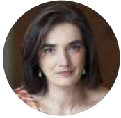
Elvira Fortunato Ministra da Ciência, Tecnologia e Ensino Superior