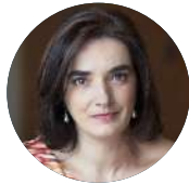
Elvira Fortunato Ministra da Ciência, Tecnologia e Ensino Superior