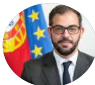
Duarte Cordeiro Ministro do Ambiente e da Ação Climática