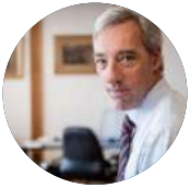
João Gomes Cravinho Ministro dos Negócios Estrangeiros