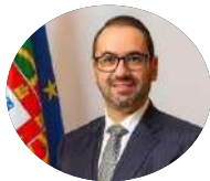
André Moz Caldas SE da Presidência do Conselho de Ministros